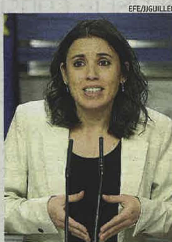
Irene Montero, ayer.

La portavoz de Podemos aprovechó, además, para volver a instar a la conformación de un Gobierno alternativo en Murcia, y mostró su disposición a seguir hablando con el PSOE para intentarlo. No obstante, admitió que lo que ocurrirá ahora depende de la posición de Ciudadanos. «Entonces tendrán que hablar los murcianos», consideró la dirigente de Podemos.